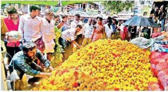
పూలు కొనుగోలు చేస్తున్న ప్రజలు