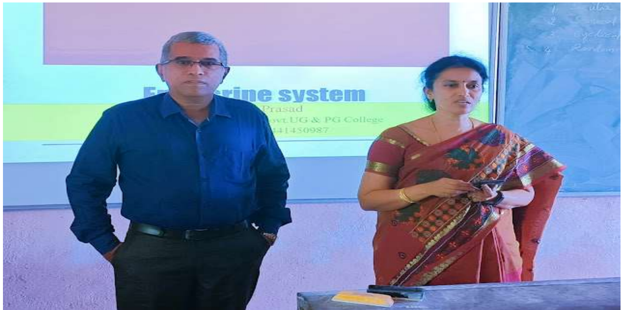
Faculty members sharing their expertise with the students of GDC Uravakonda