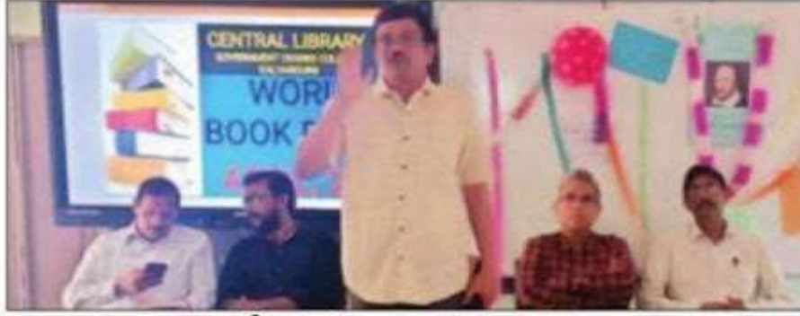
పుస్తక దినోత్సవం సందర్భంగా మాట్లాడుతున్న అధ్యాపకులు