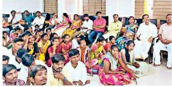
సంప్రదాయ దుస్తుల్లో అధ్యాపకులు, విద్యార్థులు