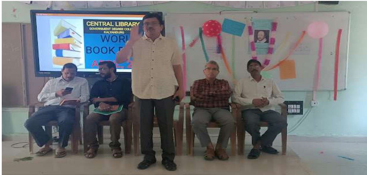
Principal addressing students on World Book Day April 23 rd 2022