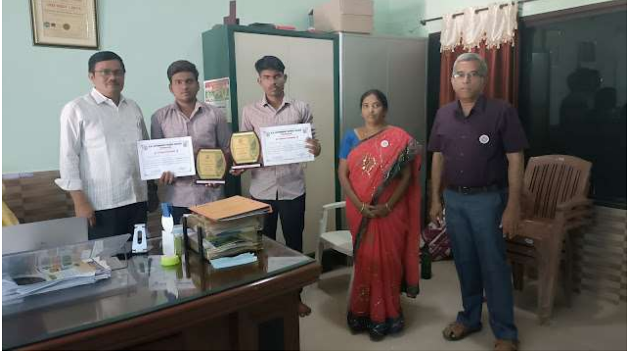
Prize winners of district level English quiz organized by GDC Dharmavaram on April 23 rd 2022