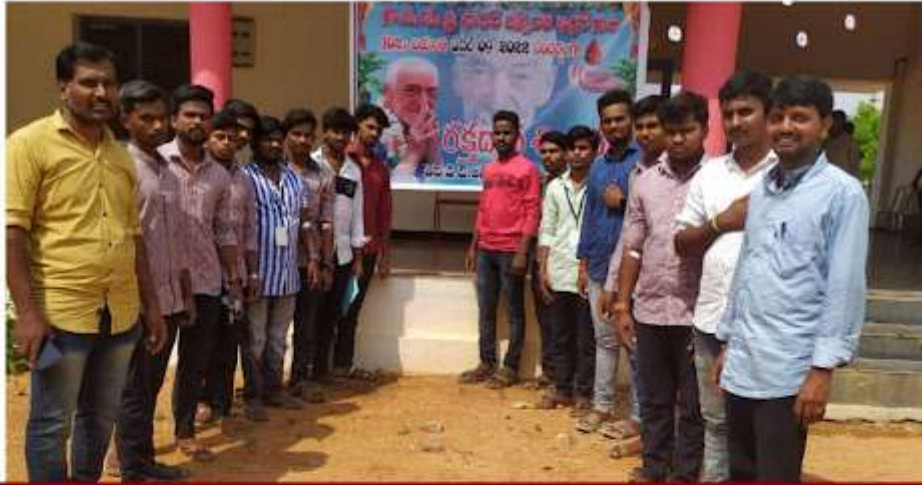
GDC Kalyandurg students after donating blood on RDT Ferrer Birth anniversary