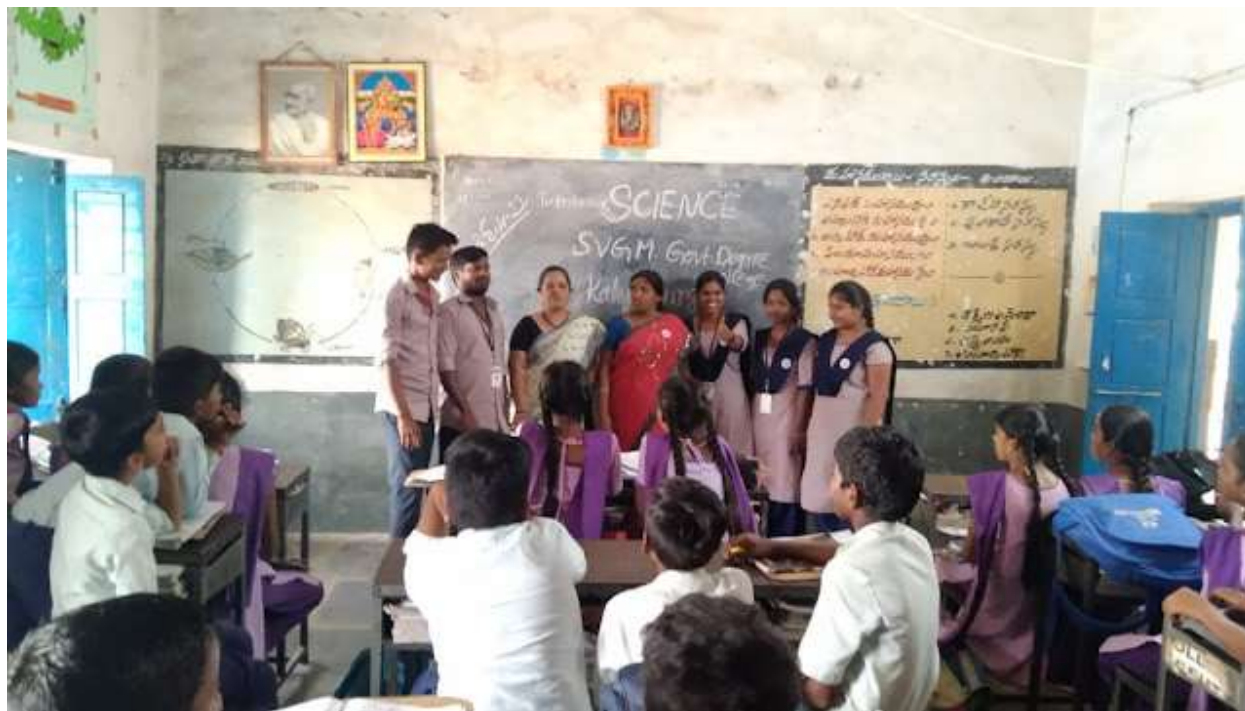
Students as teacher in ZP High School, Mallapuram on April 27 th 2022