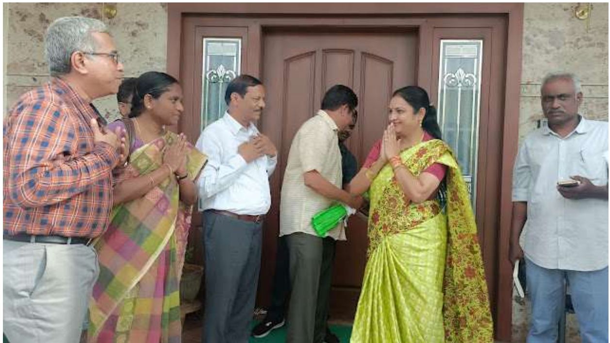
Courtesy visit to Minister of AP Government Smt. Usha Sri Charan on April 23 rd , 2022