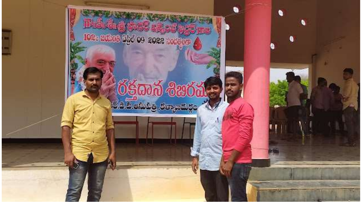
Students donating blood on 9 th April 2022 in RDT hospital on the occasion of Father Ferrer Birth Anniversary

Many of our students receive scholarship and financial assistance from RDT established by Father Ferrer. As a token of gratitude nearly 26 students of GDC has donated blood on Father Ferrer birth anniversary.