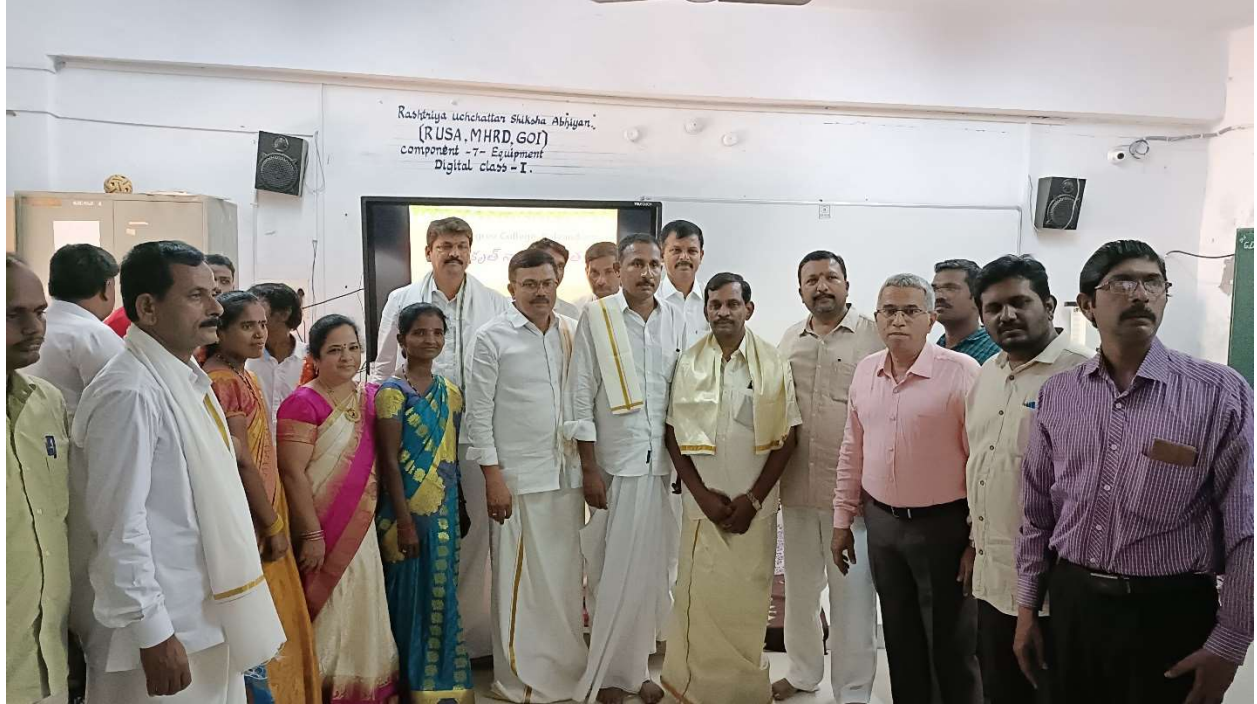
Staff with traditional dress on the occasion of UGADI