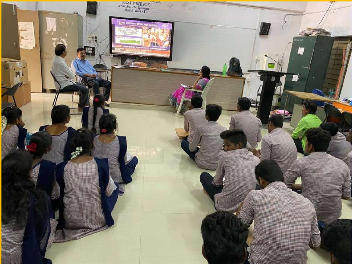
Students of Economics listening to the live Budget discussions in Parliament house on 1 st February 2023