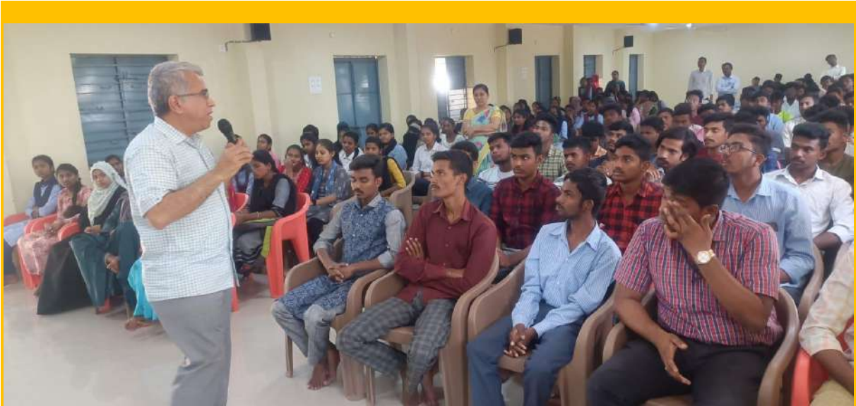
Attending the career guidance workshop organized by Radha Mahila Mandali at Sri Sankaranandagiri Degree College Guntakal