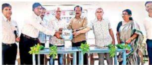
పుస్తకాన్ని ఆవిష్కరిస్తున్న అధ్యాపకులు, ప్రతినిధులు

గుంతకల్లు వట్టణం, న్యూన్ టుడే: విద్యార్థులు పోటీతత్వానికి అనుగుణంగా కెరీర్ ను మలుచుకోవాలని వక్తలు పేర్కొన్నారు. శుక్రవారం గుంతకల్లు వట్టణంలోని శ్రీశంకరానందగిరిస్వామి డిగ్రీ కళా