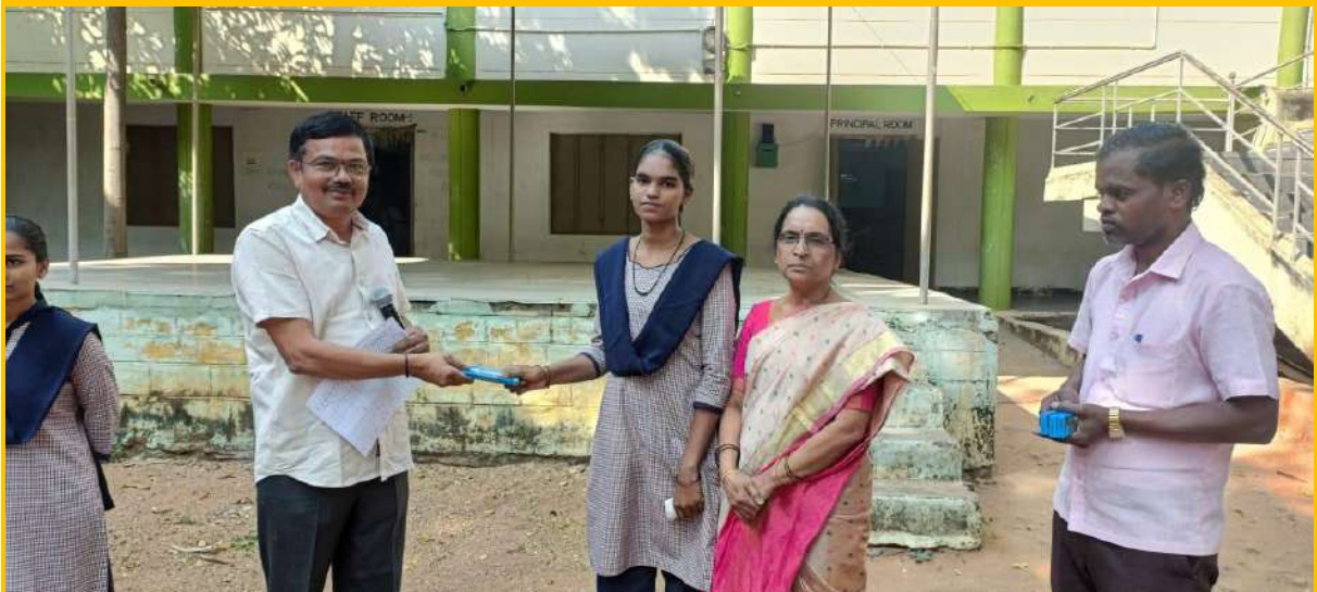
Students who are regular to the class are always honoured by our college