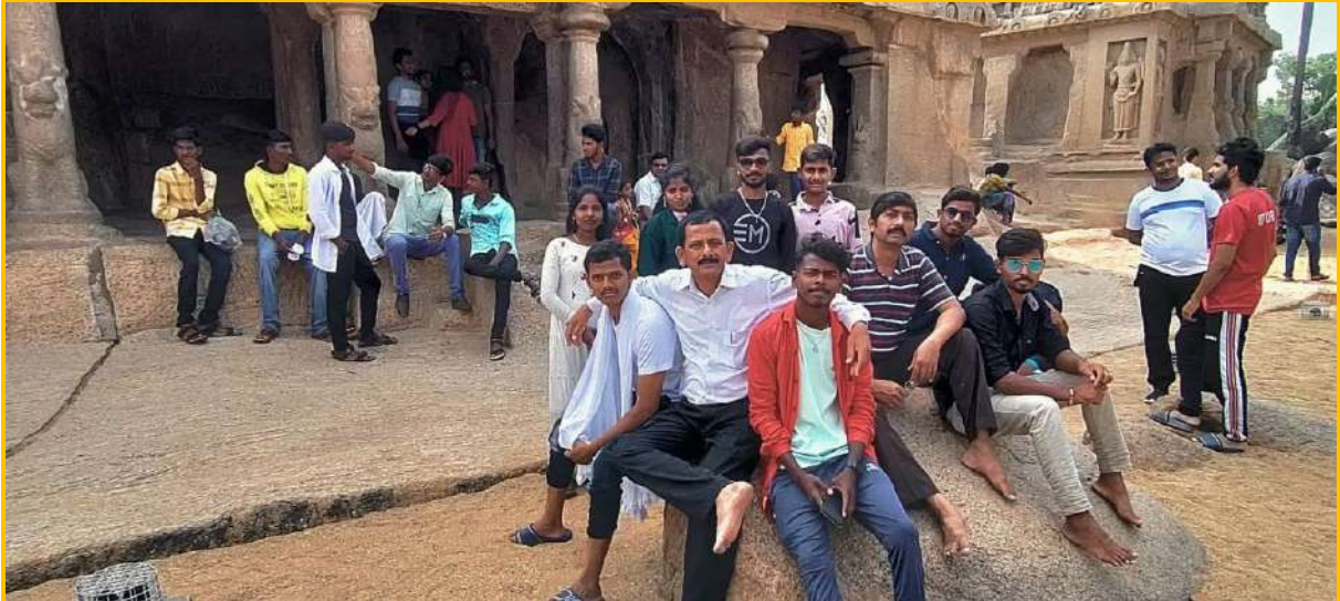
Educational tour updates