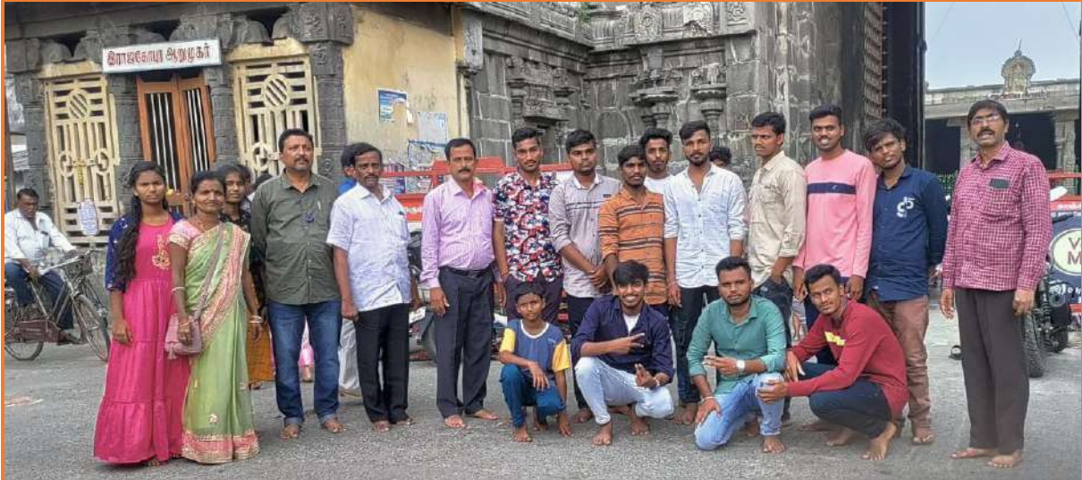
Our students in education tour at different places of Tamil Nādu state