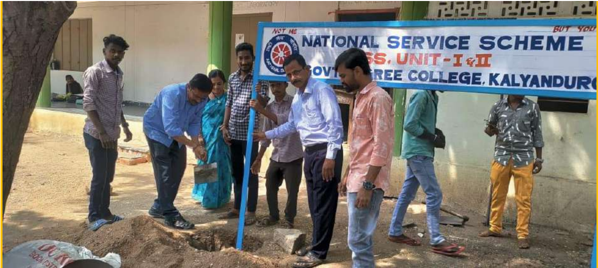
NSS volunteers giving face lift to the college