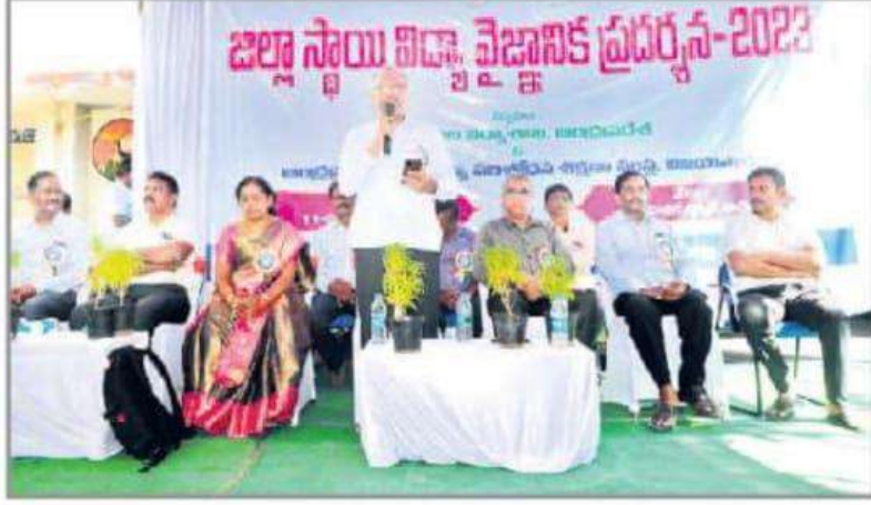
మాట్లాడుతున్న ఇన్‌చార్జ్ డీఈఓ