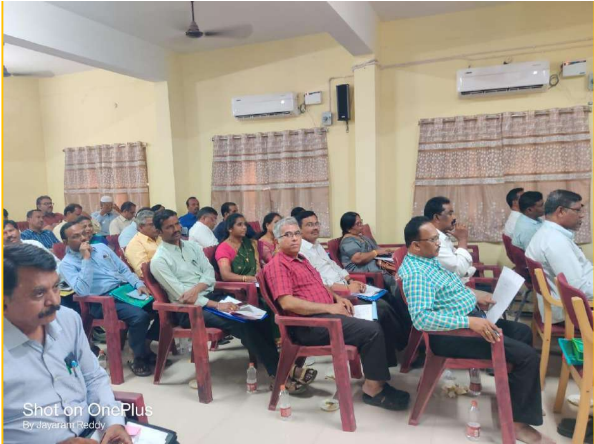
Principal and IQAC Coordinator have attended the review meet by Commissioner of Collegiate Education AP at GDC Nandhyal on 17 th February 2023. We have received sufficient inputs regarding NAAC, I map and other related issue from Commissioner