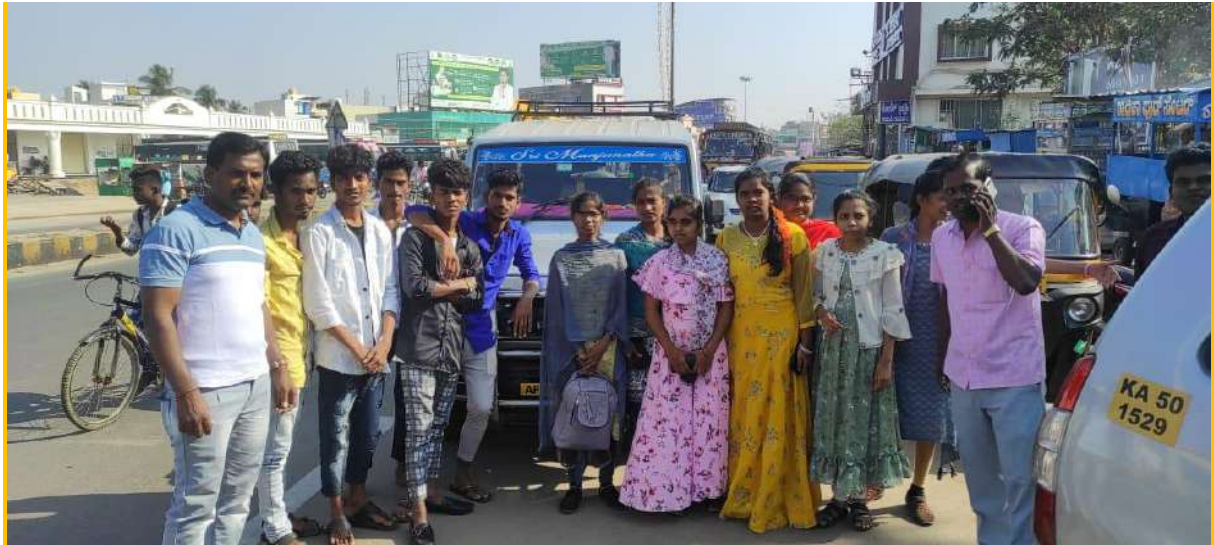
Industrial visit planned by Commerce students to Chithradurga town Karnataka