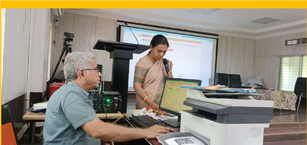
Our staff sharing the expertise as resource person in TOT on internship on the last day of training 1st February 2023