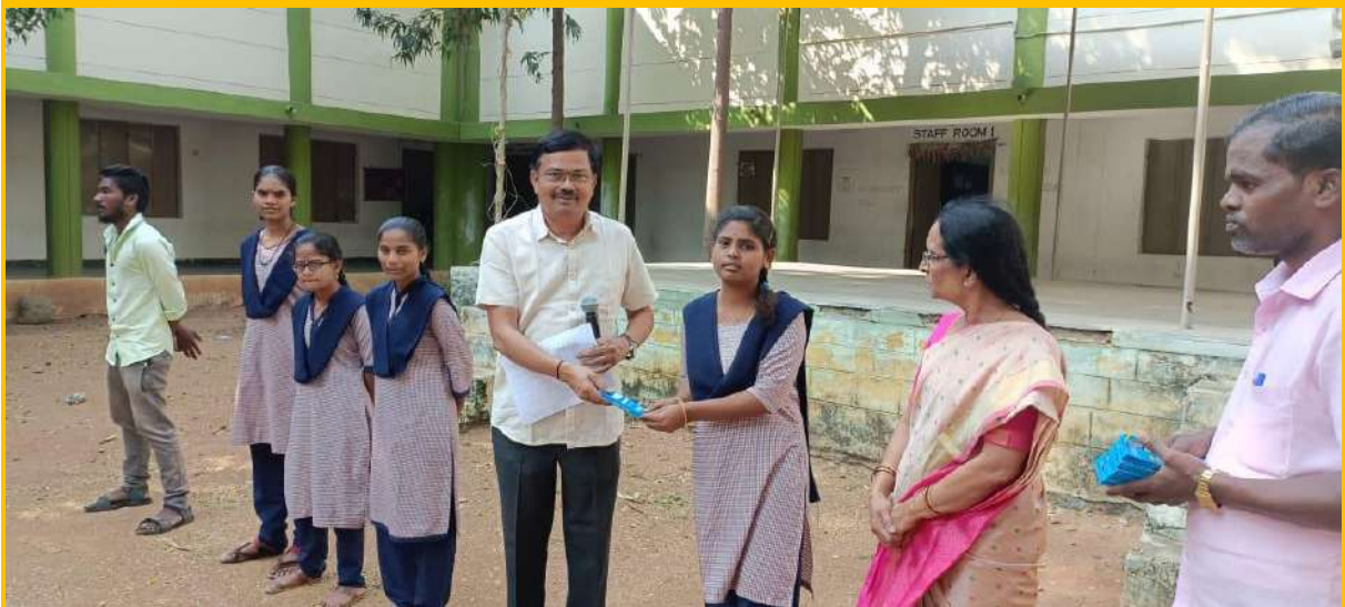
All these photographs are related to the distribution of prizes to the students who have registered more than 90% attendance