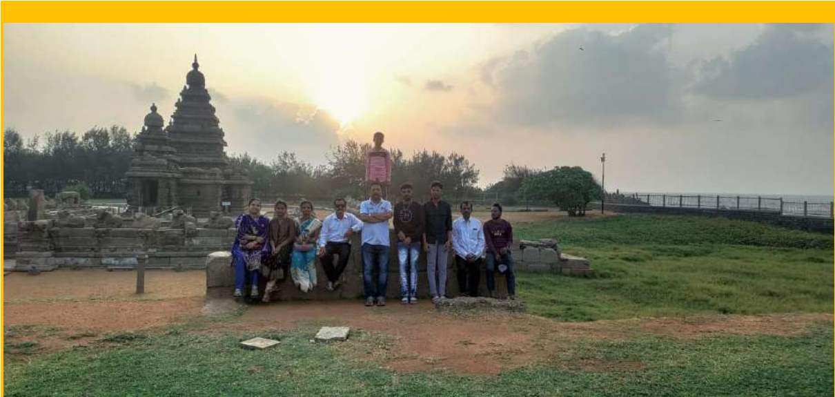
Educational tour updates