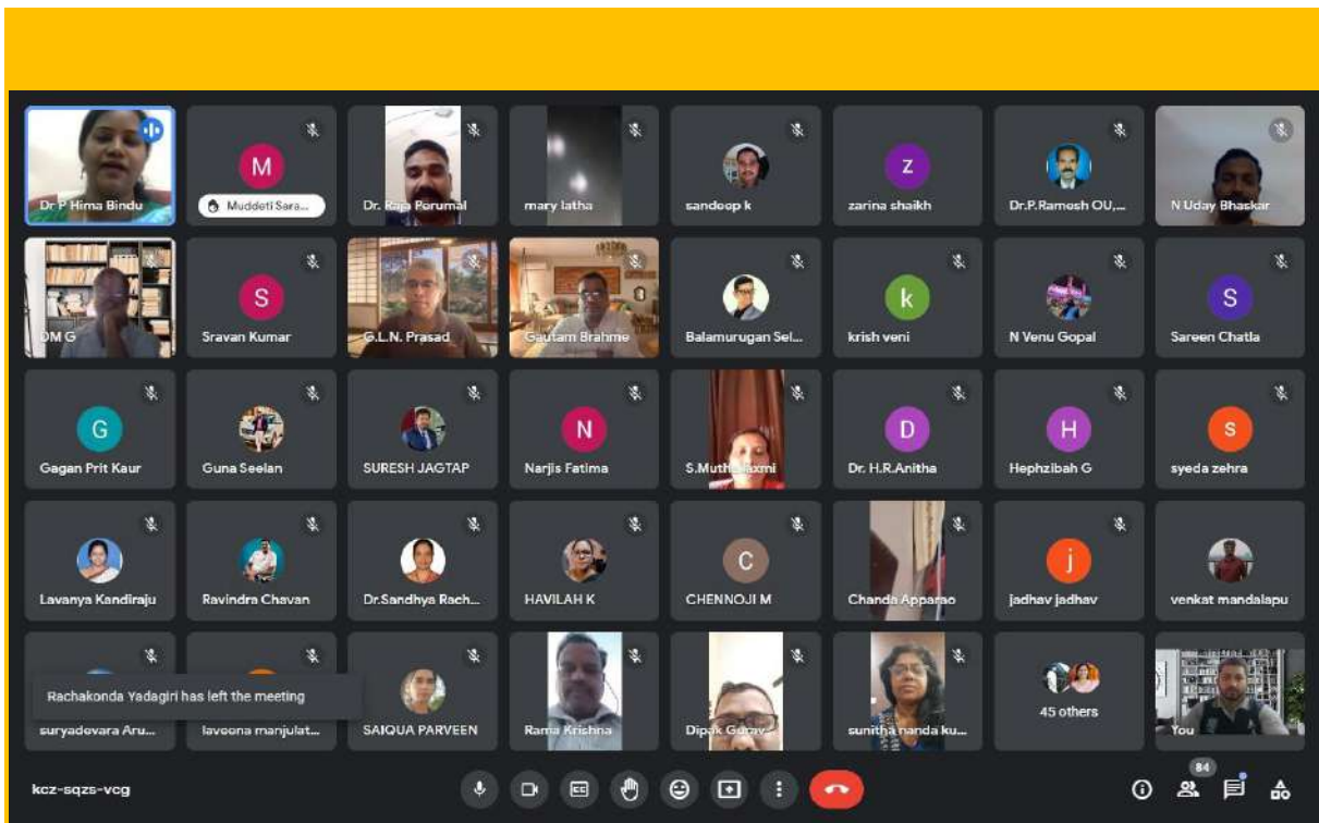
Faculty member G.L.N.Prasad participating in online session on Capacity Building on 21 st February 2023