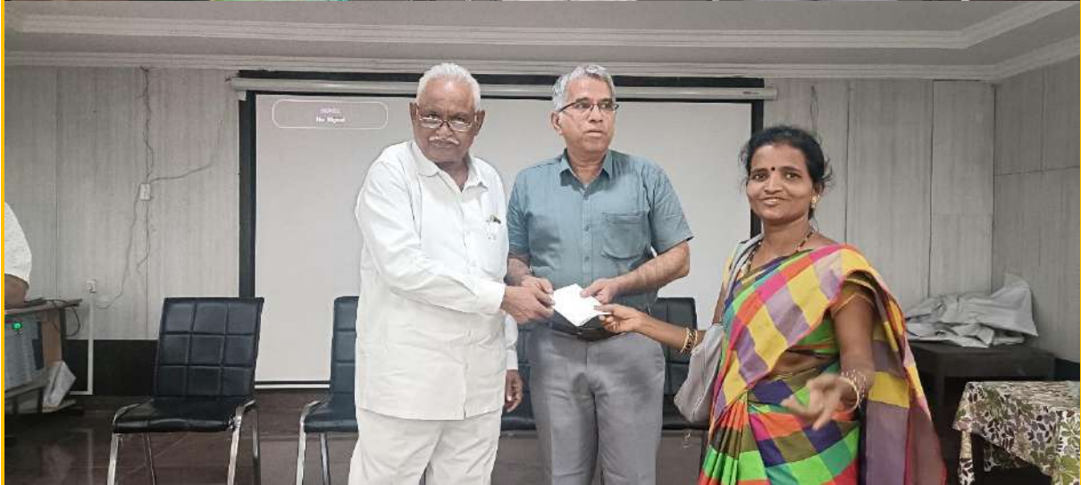
Faculty members of GDC Kalyandurg are trained in the Third phase of internship TOT on internship and LMS video making. These photos are related to the valedictory function held on 1 st February 2023