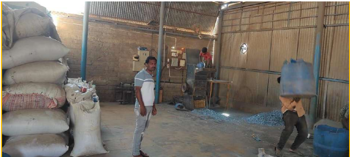
Updates of industrial tour undertaken by Department of Commerce at Chithradurga