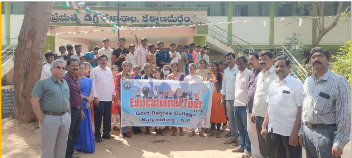
Our college students started for education tour on 2 nd February 2023 at 9pm and this tour is of three days duration.