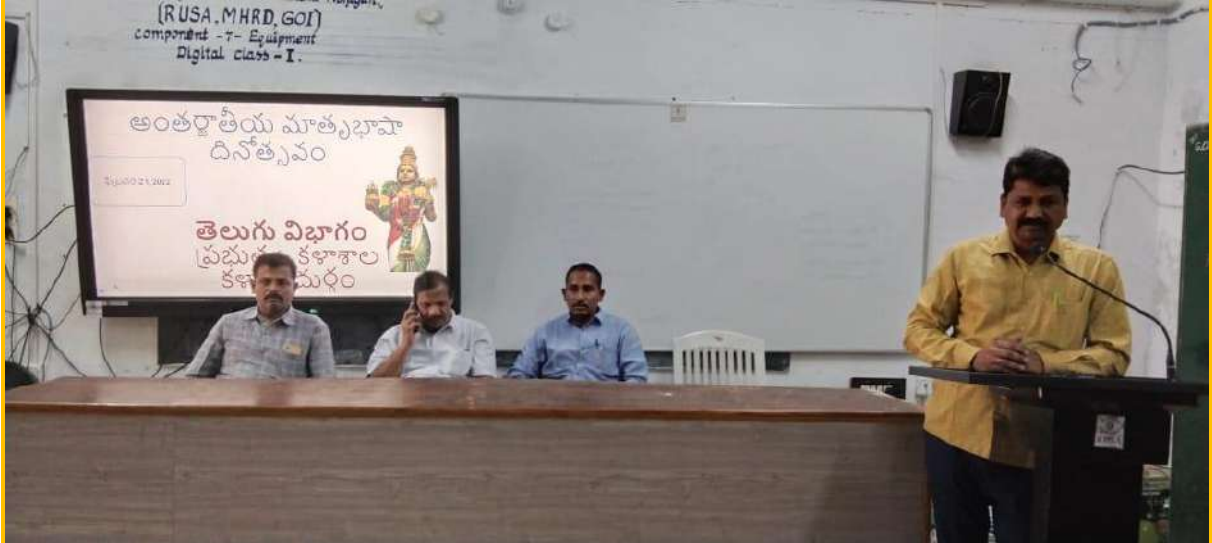
Celebration of Mathru Basha Dinotsavam on 21 st February 2023 by Department of Telugu