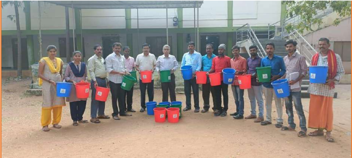
Municipal authorities have donated 24 dust bins to our college