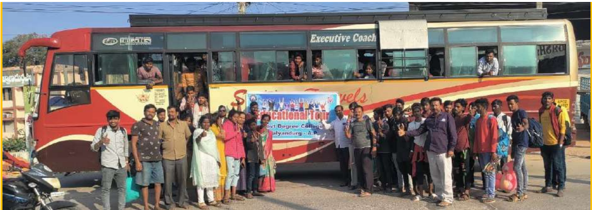
Returning from Educational tour