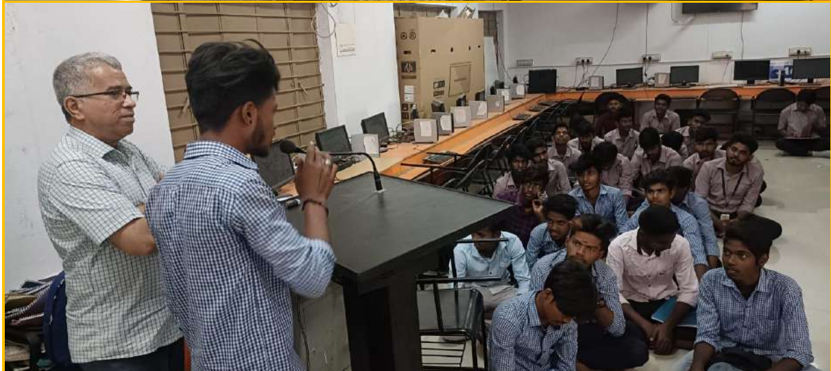
Open day was celebrated and students of nearby Government Junior Colleges visited our college and they joined the workshop on foldscope