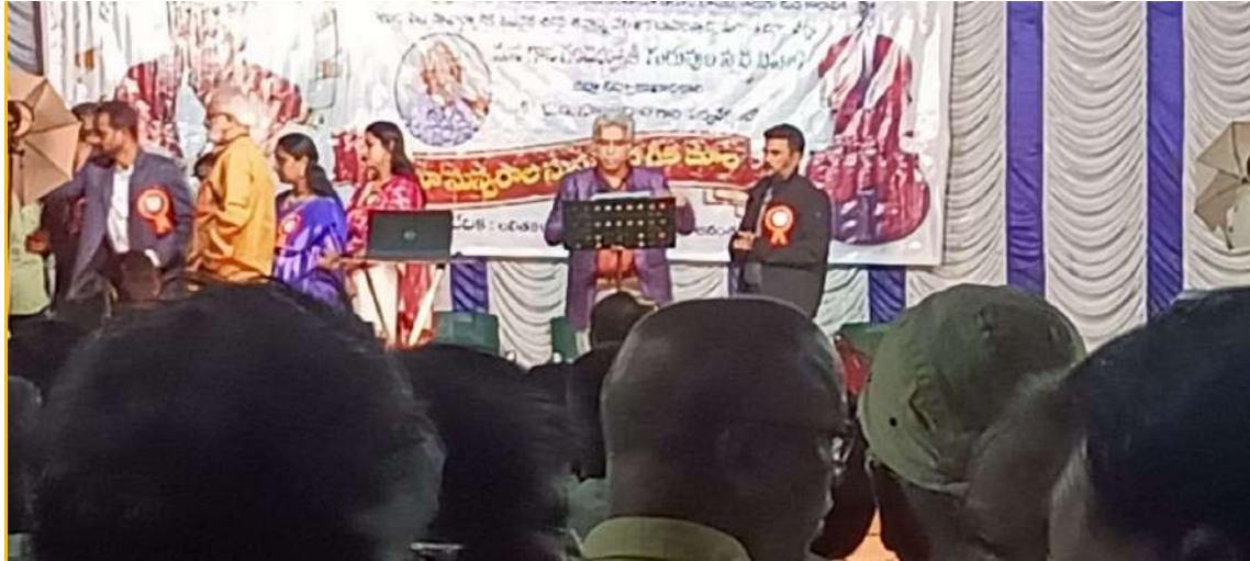
Faculty member playing the role of anchor in the musical concerts organized by DEO of Anantapur district on 30 th April 2023