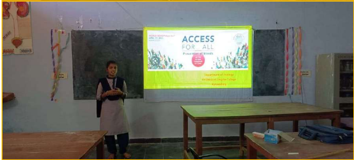
World Haemophilia day on April 17 th 2023