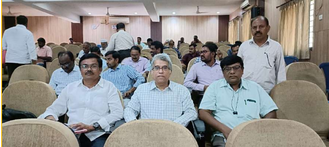
Principal & IQAC Coordinator attending the Zonal Review meet by Commissioner of Collegiate Education at Padmavathi Mahila University, Tirupati on 21 st April 2023