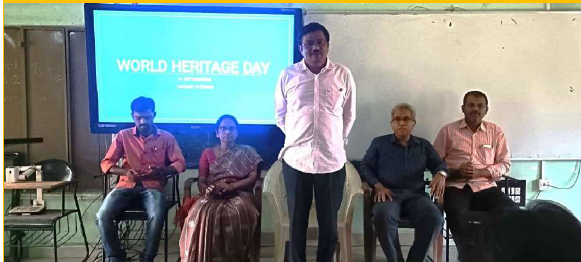
World Heritage day April 18 th 2023 Celebrations. Principal illustrated the importance of cultural heritage, the need to celebrate the diversity of our shared human society.