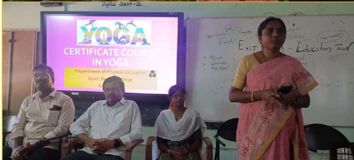
Certificate Course in Yoga inauguration on 10-4-2023. Principal stated that importance of the yoga that it is necessary for increasing the concentration of the students.